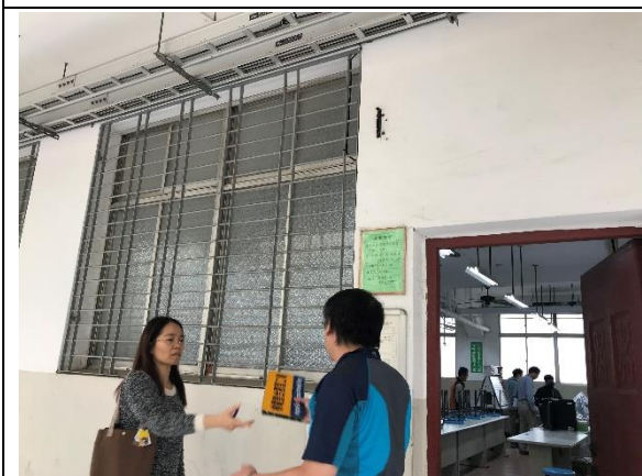
機電整合實習工場