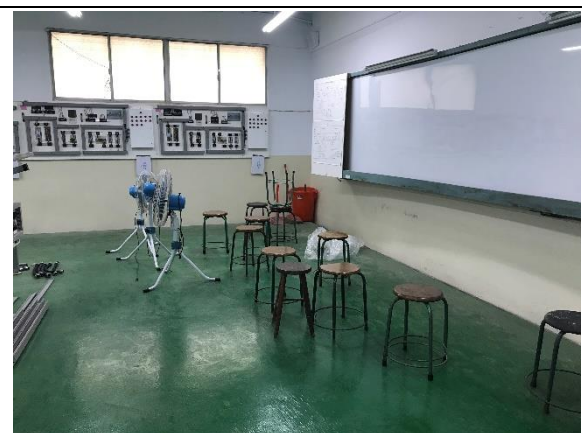
機械基礎實習工場