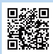
食品業者登錄平台