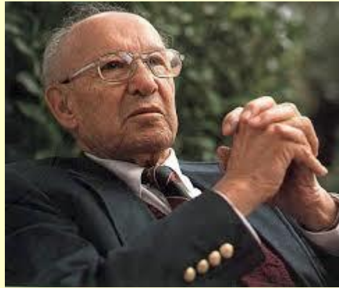
彼得·杜拉克