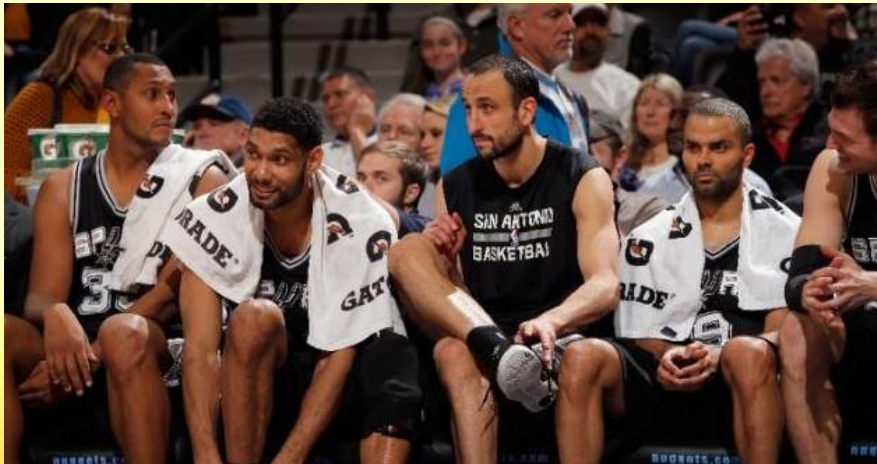
NBA馬刺隊球員