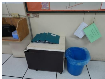
(工場內需要放置上課記錄表與日誌)