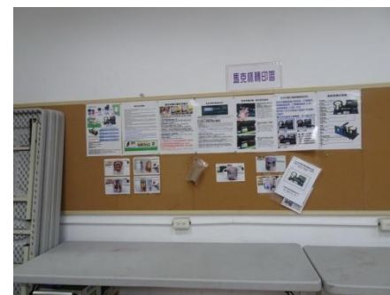
(牆上張貼設備介紹與相關使用說明)