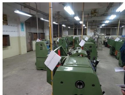
(每部機器設備需要有手冊或使用記錄)