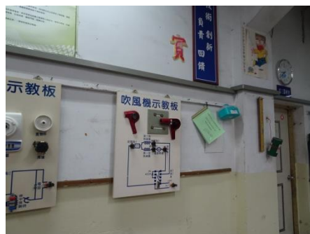
(課程內容教材範本)